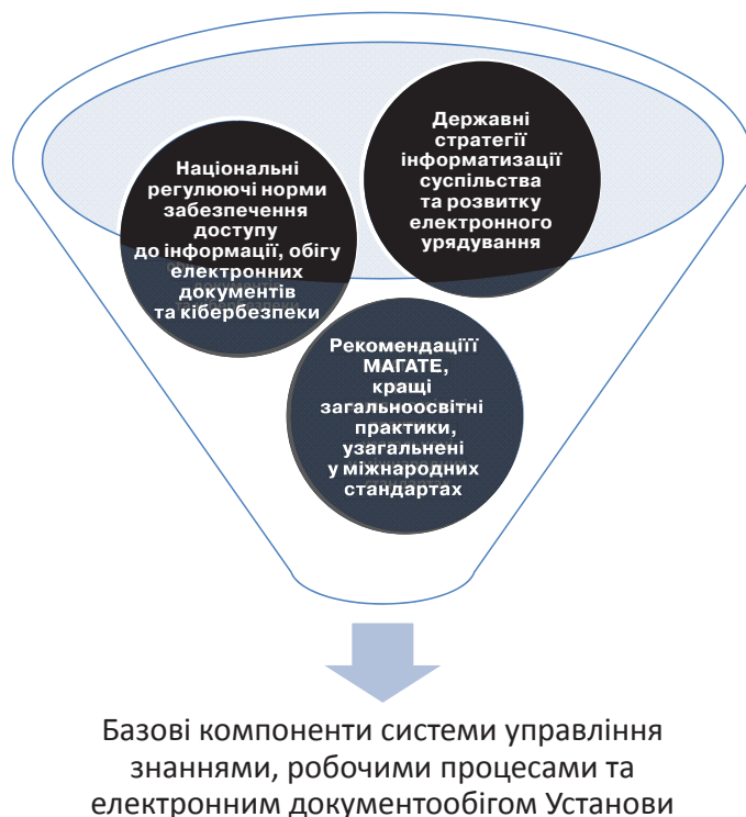
Рис. 2. Джерела нормативно-правового забезпечення побудови Порталу знань як елемента системи управління

б) самооцінку першими керівниками готовності впровадження суттєвих змін «статус-кво»;