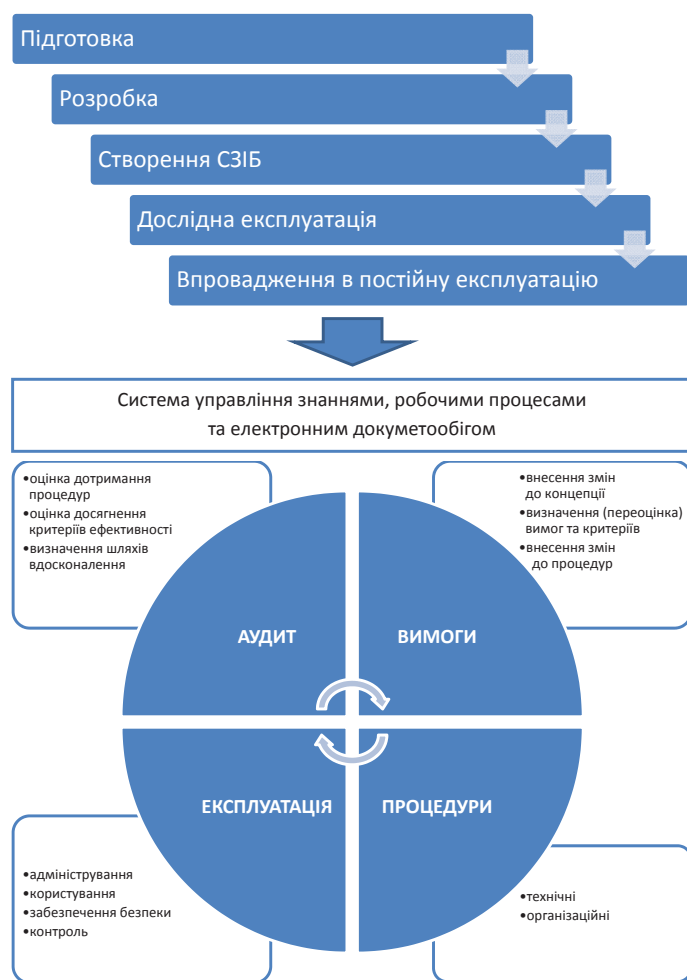
Рис. 1. Розробка, впровадження та забезпечення життєвого циклу системи управління знаннями, робочими процесами та електронним документообігом

технологій, здатна позитивно вплинути на якість та ефективність виконання основних завдань та функцій Держатомрегулювання, визначених Постановою Кабінету Міністрів України від 20 серпня 2014 року № 363 «Про затвердження Положення про Державну інспекцію ядерного регулювання України» щодо забезпечення формування та реалізації державної політики у сфері безпеки використання ядерної енергії.