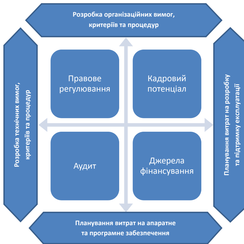
Рис. 4. Базові складові оцінки можливостей створення системи управління знаннями, робочими процесами та документообігом

знаннями як стосовно практичних питань руху документів, так і нормативної бази;