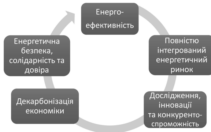
Рис. 2. Пріоритетні напрями діяльності Енергетичного Союзу

Першу оцінку процесу імплементації положень Енергетичного Союзу за кожним з напрямів Єврокомісія дала вже наприкінці 2015 року в документі «Стан Енергетичного Союзу 2015» [8]. Цей документ також наголосив на важливості розробки інтегрованих національних планів з енергетики і клімату та надав країнам ЄС рекомендації щодо підготовки таких планів на період до 2030 року. Кожна країна ЄС у 2017 році розпочала процес розробки проектів своїх національних планів з енергетики та клімату. В 2018 році до Єврокомісії мають надійти фінальні варіанти цих документів. Очікується, що виконання національних планів розпочнеться 2019 року,